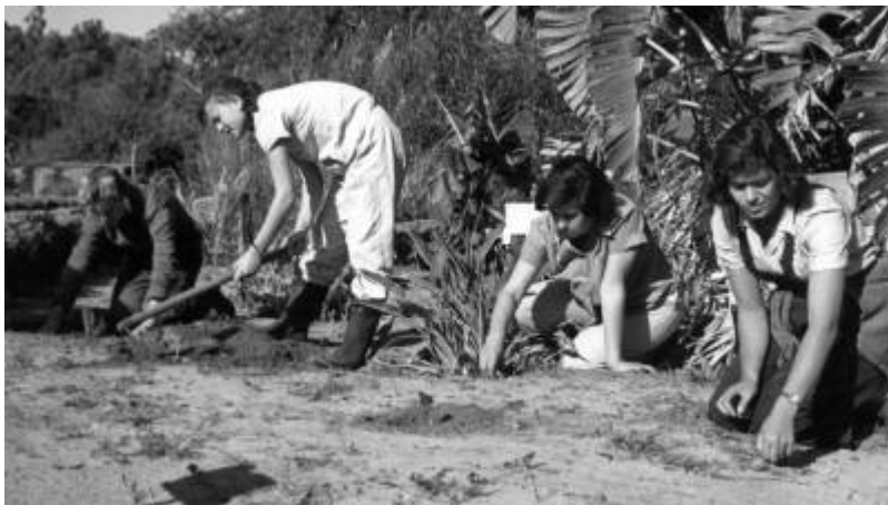
Harte Feldarbeit: Junge Frauen bei der Landarbeit unter der brütenden Sonne auf dem Feld eines Kibbuz in Israel. (undatierte Aufnahme)

1) Leben im Kibbuz (Plural: Kibbuzim) bedeutet "Sammlung", "Versammlung" oder "Kommune" und bezeichnet basisdemokratisch organisierte Gemeinschaftssiedlungen, in denen so gut wie alles geteilt wird.