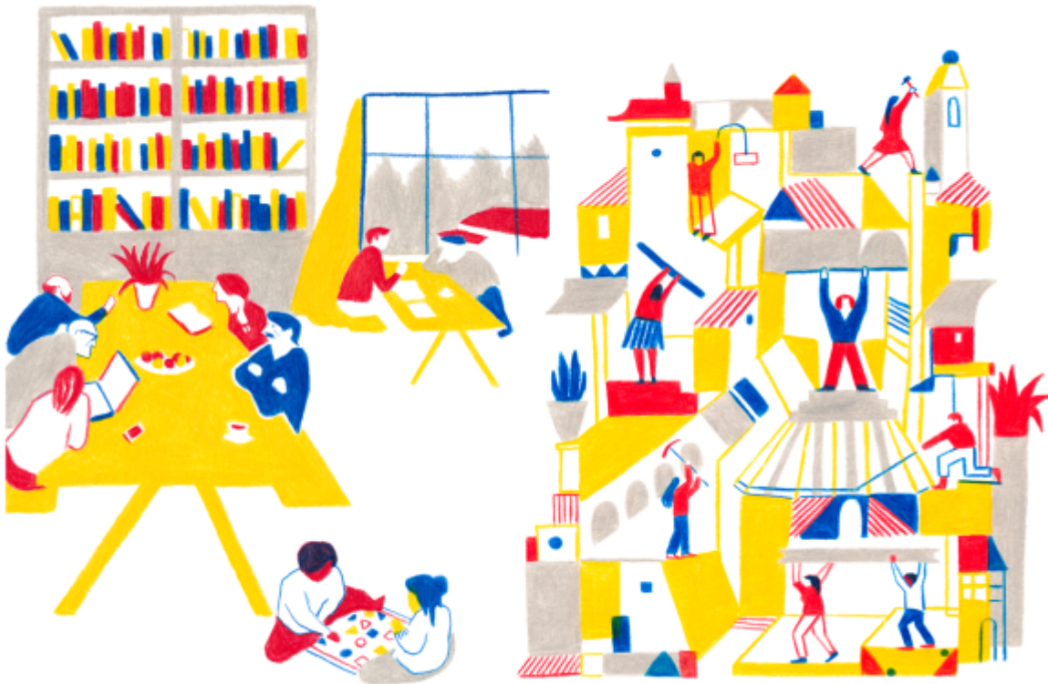
Illustration: Pau Gasol Valls

Mina Le "third places, stanley cup mania, and the epidemic of loneliness" https://www.youtube.com/watch?v=KqjpuUJQFcM