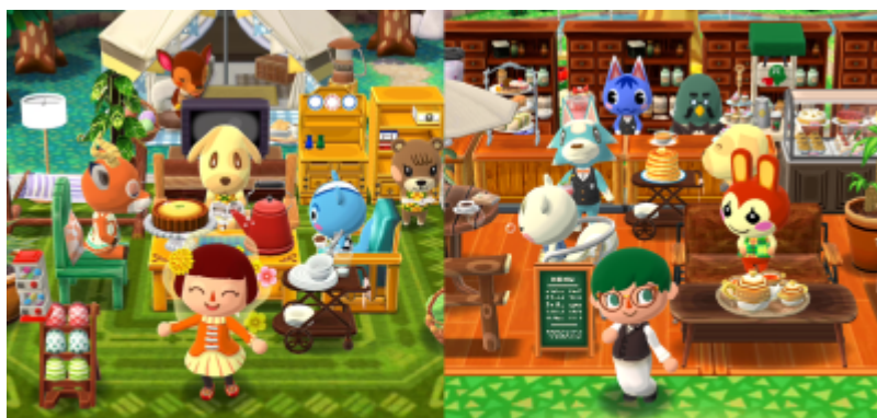
Stell Einrichtung für den perfekten Zeltplatz her.